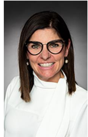
L'honorable Filomena Tassi, C.P., députée

L'Agence reste déterminée à valoriser le potentiel inexploité de la population, des entreprises et des collectivités du Sud de l'Ontario pour contribuer à la réussite actuelle et future du Canada.